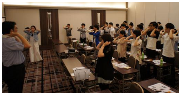
昨年のフレッシューズセミナーの様子 肺野体操で肺の区分を覚える

【申し込み方法】 案内が封書で届いておられる新卒者の方はそれに同封の返信はがきにてお願いします。